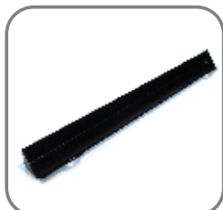
814-ET-102 Auffangrinne für Strahlmittel