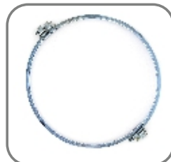
814-EP-007 Spannring 1-3 DN 450mm