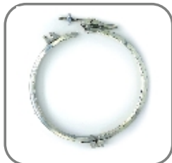
814-EP-006 Spannring 4 DN 200mm