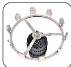
814-ET-147 Trägerhülse „Feder“ (ohne Federn)