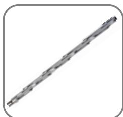
814-ET-107 Drehspieß aus Aluminium mit Aufnahmen (ohne Motor)