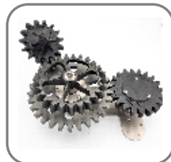
M000127 verstellbarer Werkstückträger 45°