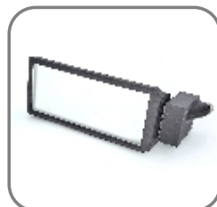
814-ET-104 Maschinen- Statusleuchte