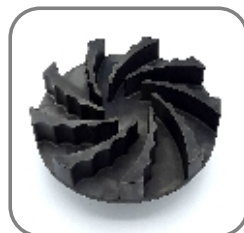
814-ET-110 HPC-Schleuderrad 160S9-35