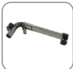
814-ET-136 Ersatzteilkit „Injektor“ TWISTER