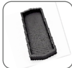
814-ET-149 Abdeckung Sichtfenster seitlich