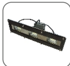
814-ET-137 Arbeitsraum- leuchte