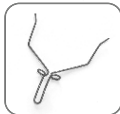
814-ET-114 Feder für Federaufnahme und Trägerhülse Feder