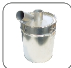
814-ET-105 Vorabscheider 30L