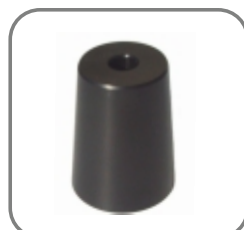
814-ET-139 Werkstückadapter für Kegelrad verstärkt VA