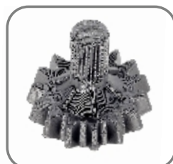
814-ET-143 Trägerrad komplett inkl. Lager