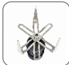
815-ET-146 Trägerhülse „Universal“