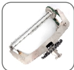
M000032 Werkstück- aufnahme „Linear“