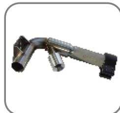
815-ET-136 Ersatzteilkit „Injektor“ TORNADO