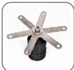
814-ET-145 Trägerhülse „Standard“