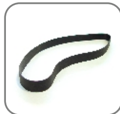
814-ET-116 Hochleistungs- flachriemen 970 x 25 x1