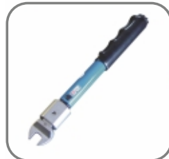
814-EY-001 Drehmoment- schlüssel 7Nm feineingestellt